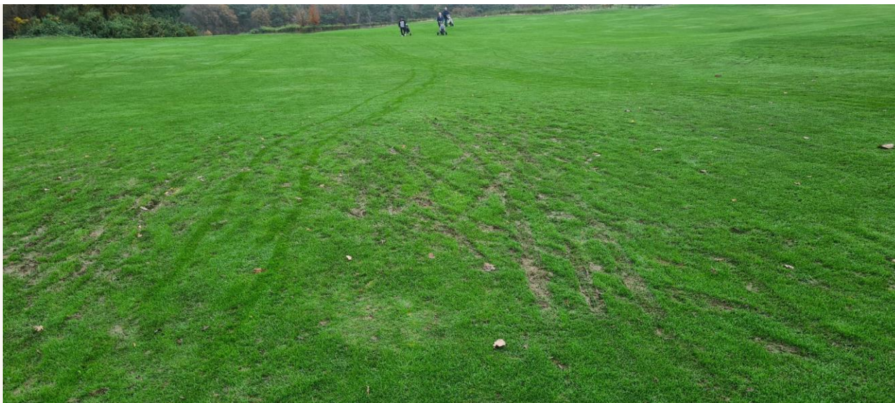
Schade op de fairway van Noord 6 door trolleys

Ook in onze regio Gelderland, Limburg en Brabant zijn enkele golfbanen getroffen en hebben ze hun deuren moeten sluiten vanwege de intensiteit van de regen. Omdat onze Baan hoog en op een zanderige grond ligt hebben wij op het Rijk van Nijmegen over het algemeen onze deuren open kunnen houden. Wel hebben wij bijvoorbeeld maatregelen zoals “geen buggy’s en alleen draagtassen toegestaan” dit om verdere schade aan de baan te voorkomen. Wij hopen hierbij op uw begrip.