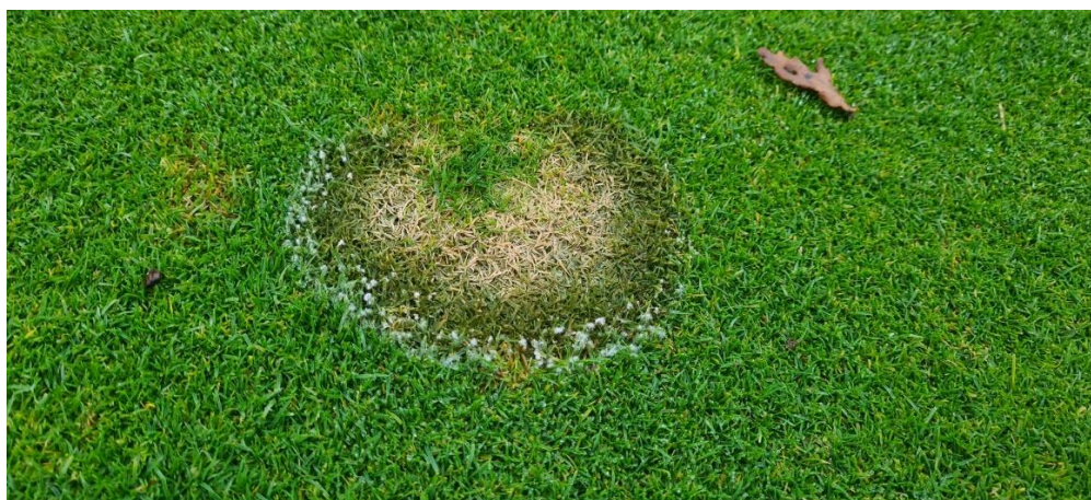
Ook schimmels houden van vocht en hogere winterse temperaturen. (hier sneeuwschimmel)

“De regen die valt is altijd nodig voor onze golfbaan, helaas valt deze regen vaak wanneer het niet uitkomt. Dit hebben we ook dit jaar weer ervaren zo hebben we in het voorjaar te maken gehad met een watertekort en in de zomer en winter te maken met een wateroverschot. Normaal hebben we jaarlijks tussen de 800 mm en 900 mm neerslag, hier zijn we dit jaar 400 mm overheen gegaan met een record regenval van 1312 mm . Dit is dan ook zeker te zien en te merken op onze golfbaan, zo zijn sommige plekken in slechte conditie en is de baanconditie in zijn algemeen minder.